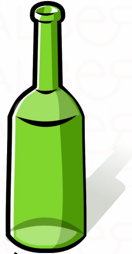
La longitud de esta botella